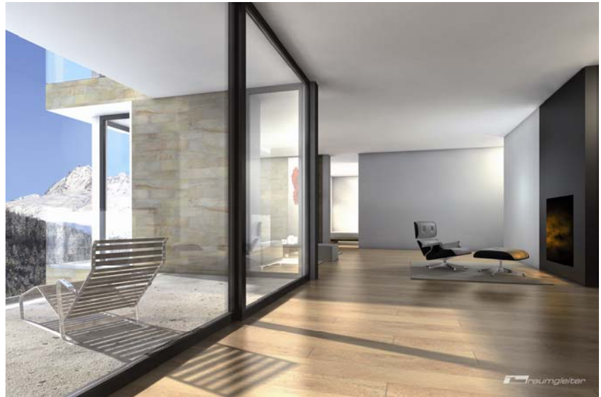
High-End-Rendering mit CINEMA 4D, Copyright raumgleiter, Architekt M. Schumacher