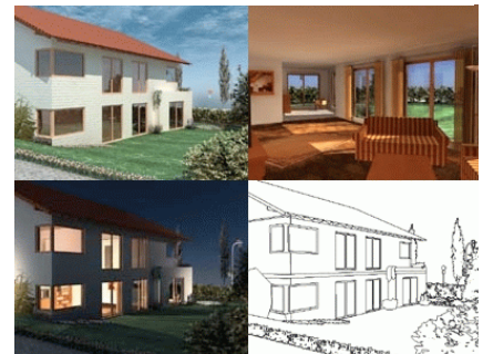
Tag-, Nacht-, Innen-, und Comic-Ansicht

CINEMA 4D lässt sich hervorragend zusammen mit Allplan einsetzen. Die für Allplan charakteristischen Datenstrukturen werden 1:1 in CINEMA 4D wieder abgebildet und stehen zur weiteren Bearbeitung zur Verfügung. Der Clou an der Datenübergabe zwischen Allplan und CINEMA 4D ist die komfortable Verbindung der beiden Programme mittels Update-Plug-in. So können beispielsweise Änderungen am Allplan CAD-Projekt sofort mit der Visualisierung in CINEMA 4D synchronisiert werden. Konkret heißt das, dass man z.B. ein bereits in CINEMA 4D mit Lichtern und Materialien versehenes Projekt nachträglich in Allplan bearbeiten und die