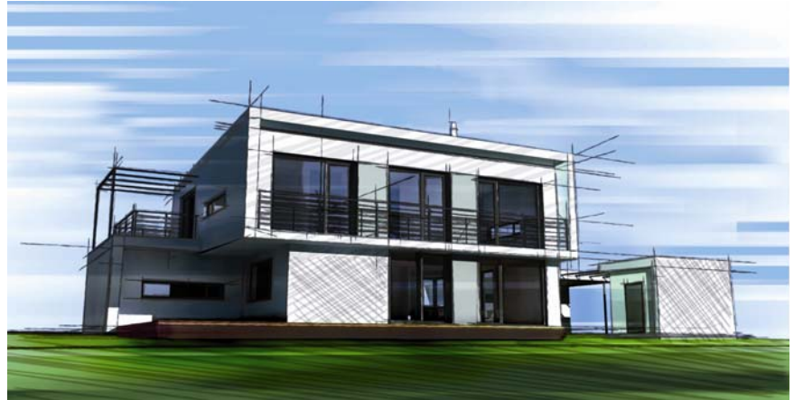
Skizzeneffekt mit CINEMA 4D, Copyright Michael Stehle Design

Die Möglichkeiten ein Bild aus dem Computer täuschend echt aussehen zu lassen, sind im Laufe der Jahre immer besser geworden. Nun holt CINEMA 4D zum nächsten Schlag aus. NPR heißt das Zauberwort: Non-Photorealistic Renderer. Das bedeutet nichts anderes, als dass nun auch all das möglich ist, was nicht unbedingt realitätsnah oder fotorealistisch aussehen soll. Die Vielzahl der Stile, die sich mit Sketch and Toon erzeugen lassen, ist beinahe grenzenlos.