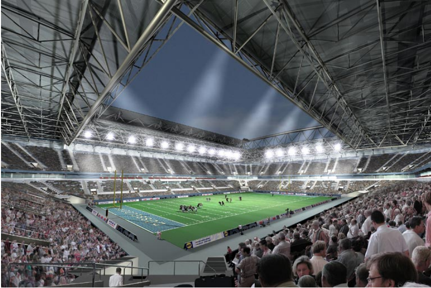
Abbildung: Multifunktionsarena Düsseldorf, visualisiert mit CINEMA 4D von bgp design, Stuttgart, ausgezeichnet mit dem Animago Award '03