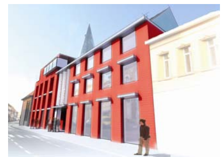
Skizzeneffekt, Copyright Ludwig Desmet